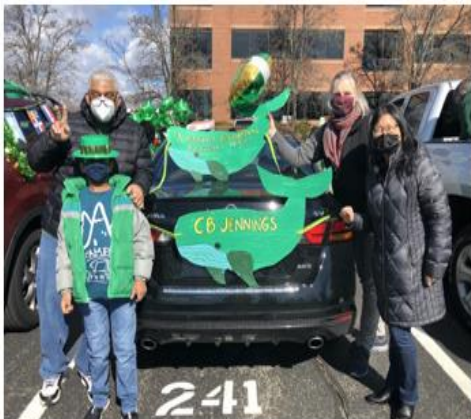
Jennings School St. Patrick's Day Car Parade