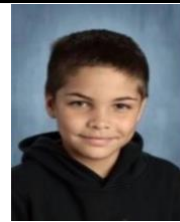
¡Celebración de la tripulación!

Tomamos asistencia todos los días, esperamos ver a nuestros estudiantes cada Mañana. Si su hijo estará ausente, por favor llame a la escuela al (860) 447-6040 y háganoslo saber. A las 9:45am todos los días se envían boletines de asistencia matizadas. Si tiene más preguntas, consulte el manual para padres en línea o comuníquese con nuestro Trabajadora Social de la escuela, Sra. Balestracci en balestraccik@newlondon.org