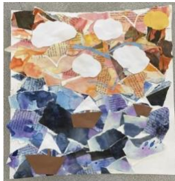
Mackenzie Butler (4º grado)

Su collage (adjunto) muestra atención al detalle, gran uso de materiales y decisión creativa. Para este collage de Barco en el agua, ella extrajo páginas de libros antiguos, eligió 2 páginas por estudiante y aplicó acuarela: una página contiene colores que se encuentran en el agua (tonos de azul), los otros que contienen colores que encontramos en el cielo (tonos de amarillo). Después del secado, las páginas se rompieron en tiras y se pegaron a otro espacio en blanco en una hoja de papel. Finalmente, recortamos formas de papel de construcción para crear veleros, nubes y aves (o islas, soles, etc.). ¡Felicidades, Mackenzie!