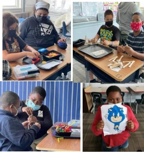
Desafío STEAM de 5 grado y Artista de la semana